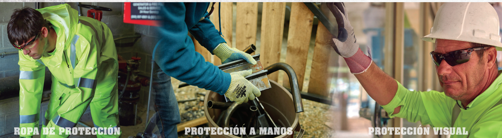
ROPA DE PROTECCIÓN