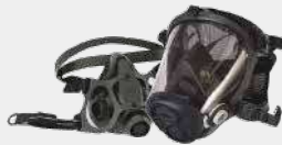
Piezas faciales media cara y cara completa