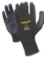
Guantes de uso general en nylon y poliuretano