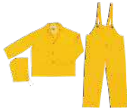
Trajes antifluidos lavables