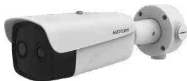
Solución profesional completa