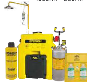
Duchas de emergencia