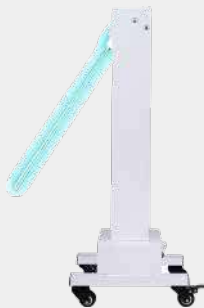
Lámpara germicida UV pro