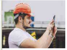
Trabajador en un campo