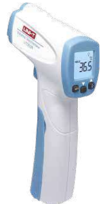
Termómetro infrarrojo UT300R