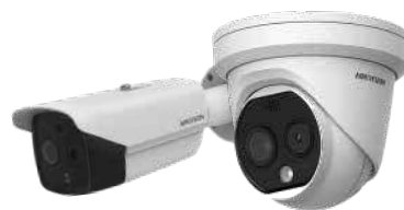
Solución eco completa